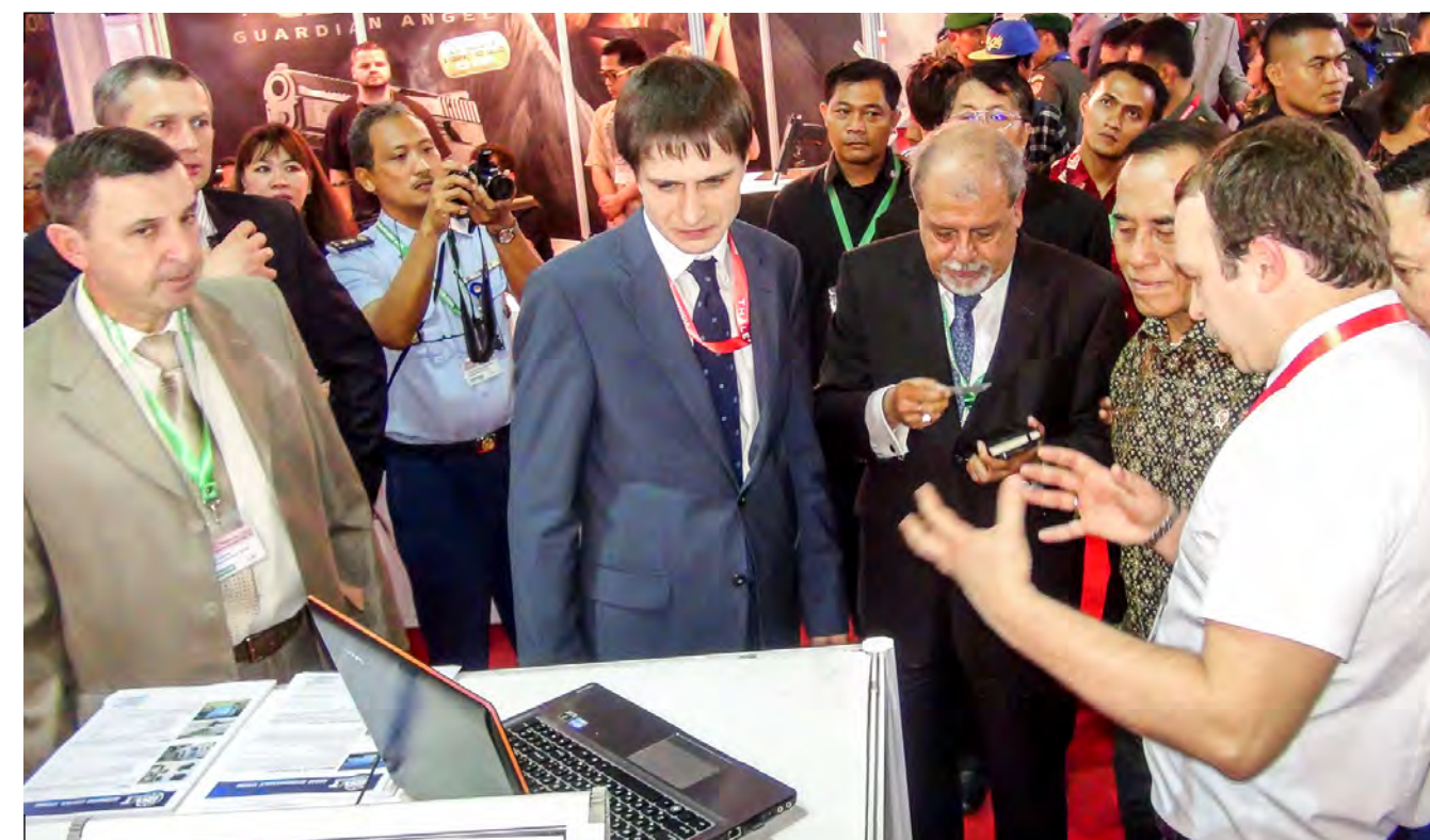
Представители официальной индонезийской делегации знакомятся с возможностями ГВТУП «Белспецвнештехника» в ходе выставки INDO DEFENCE EXPO 2014 (Джакарта, Индонезия) Representatives of the official Indonesian delegation are getting acquainted with the capabilities of Belpetsvneshtekhnika during the INDO DEFENCE EXPO 2014 exhibition in Jakarta