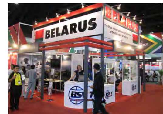
Стенд ГВТУП «Белспецвнештехника» на выставке DEFENCE & SECURITY 2012 (Бангкок, Таиланд) The stand of Belpetsvneshtekhnika at the DEFENCE & SECURITY 2012 exhibition in Bangkok

ГВТУП «Белспецвнештехника» открыто к налаживанию взаимовыгодного сотрудничества с зарубежными партнерами во всех сферах, представляющих взаимный интерес на среднесрочную и стратегическую перспективы.