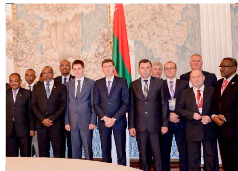
Участники научно-практической конференции «20 лет военно-технического сотрудничества ГВТУП «Белспецвнештехника» и военно-промышленной корпорации Республики Судан» The participants of the sci-tech conference "20 Years of Military-Technical Cooperation of Belpetsvneshtekhnika and Military-Industrial Corporation of the Republic of the Sudan"

most acceptable delivery terms and international payment forms, taking into account characteristics of products, location of customers, climatic conditions of a region, financial capabilities of customers and peculiarities of national legislation.