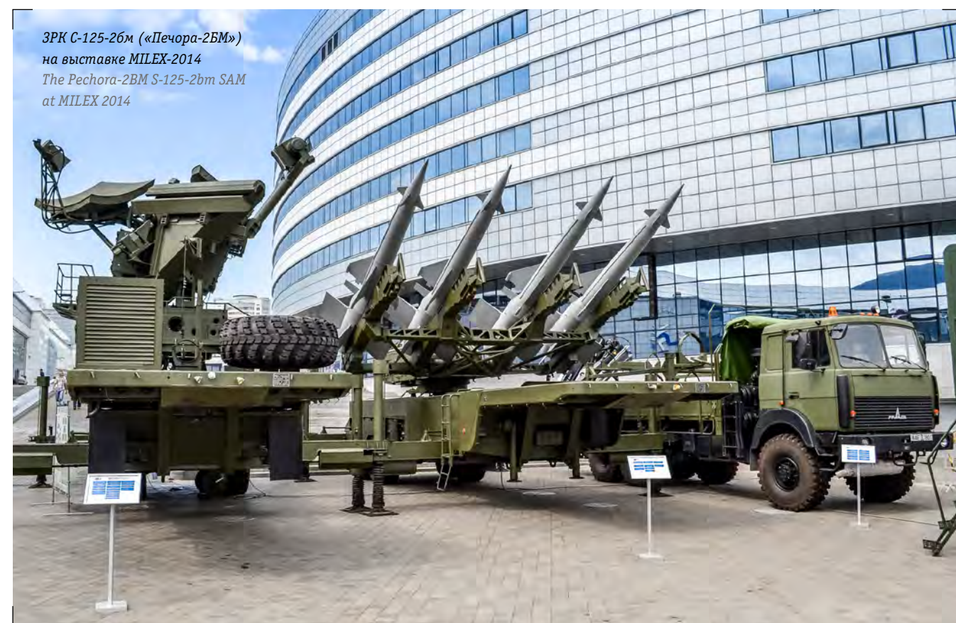
ЗРК С-125-2бм («Печора-2БМ») на выставке MILEX-2014 The Pechora-2BM S-125-2bm SAM at MILEX 2014

The company pays particular attention to the development of control technologies.