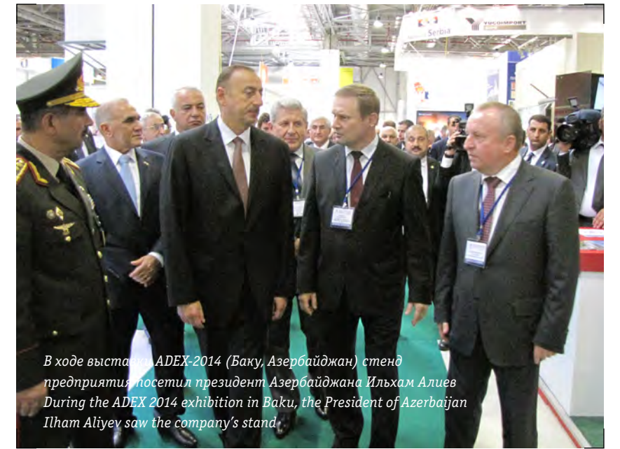
В ходе выставки ADEX-2014 (Баку, Азербайджан) стенд предприятия посетил президент Азербайджана Ильхам Алиев During the ADEX 2014 exhibition in Baku, the President of Azerbaijan Ilham Aliyev saw the company's stand

Таким образом, в структуре ГВТУП «Белспецвнештехника» появилось ООО «БСВТ — новые технологии», специализирующееся на разработке и производстве полного спектра оптической продукции — прицелах для бронетанковой техники, систем управления огнем, комплексов ПВО, стрелкового вооружения. Особенностью данных изделий стало использование в них последних достижений в области оптико-электронной техники и информационных технологий. Прицелы и приборы работают в пассивном режиме и позволяют днем и ночью скрытно обнаружить цель, оценить дальность до нее и автоматически установить прицельную марку на необходимый уровень прицеливания. В рамках