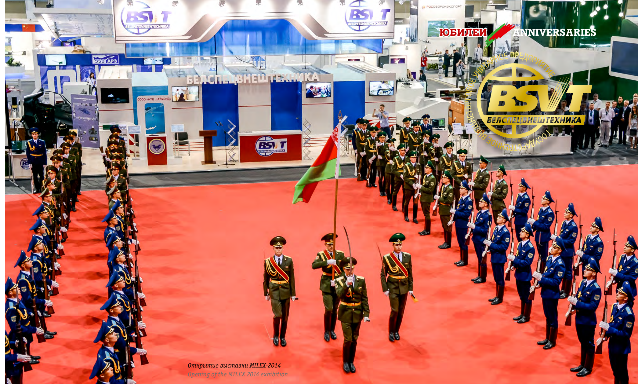
Открытие выставки MILEX-2014 Opening of the MILEX 2014 exhibition

Long-term and successful cooperation with foreign customers is achieved by Belpetsvneshtekhnika on the basis of three key principles: efficiency, reliability and quality. The company offers