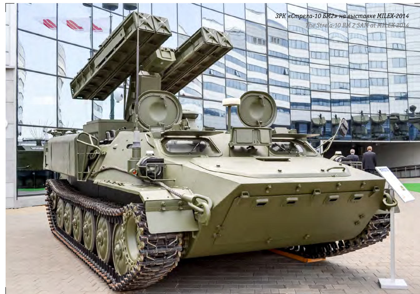
ЗРК «Стрела-10 БМ2» на выставке MILEX-2014 The Strela-10 BM 2 SAM at MILEX 2014

diagnostics and repair, as well as modern variants of weapons upgrade in the customer's companies; • export of products and services of defence companies and sale of specific products becoming available from the inventory of Defence Ministry.