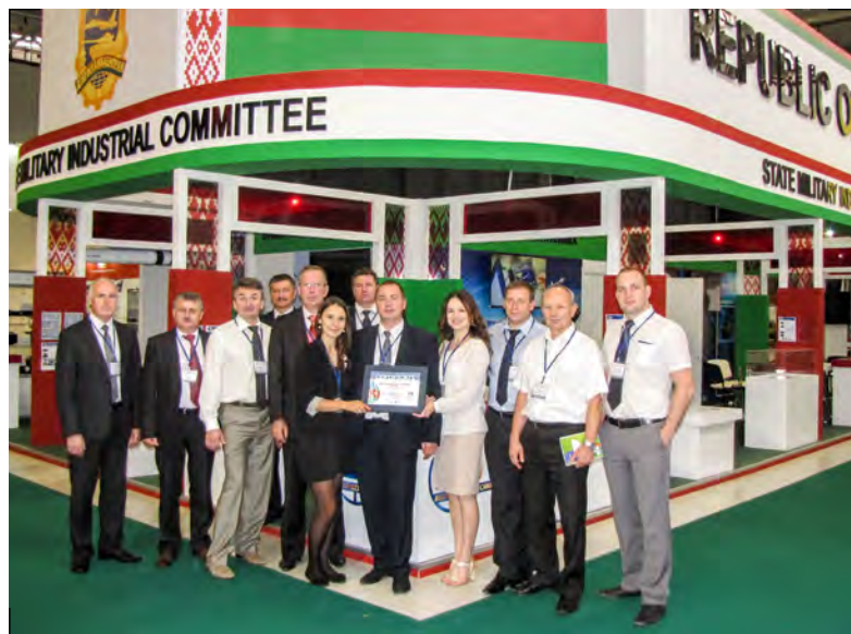
Официальный диплом выставки ADEX-2014 The official diploma of ADEX 2014

проводимой работы дочернее предприятие наладило тесный контакт с ОАО «Зенит-БелОМО» и ОАО «Рогачевский завод «Диaproектор».