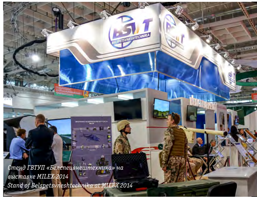
Стенд ГВТУП «Белспецвнештехника» на выставке MILEX-2014 Stand of Belspetsvneshtekhnika at MILEX 2014

diagnostics and repair, as well as modern variants of weapons upgrade in the customer's companies; • export of products and services of defence companies and sale of specific products becoming available from the inventory of Defence Ministry.