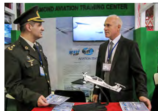
Авиационный учебный центр «Даймонд» представляет свои возможности на выставке ADEX-2014 The Diamond Aviation Training Center is presenting its capabilities at ADEX 2014

Концентрация мощного научного и производственного потенциала, значительных финансовых средств позволяет сосредоточить основные усилия ГВТУП «Белспецвнештехника» на разработке приоритетных инновационных проектов. Среди них стоит отметить капитальный ремонт с модернизацией боевой машины зенитного ракетного комплекса (ЗРК) «Стрела-10М» до уровня «Стрела-10БМ2». Реализация этого проекта позволила обеспечить режим круглосуточной работы комплекса, увеличить его боевые возможности и повысить живучесть. В ходе выставки MILEX-2014 ЗРК