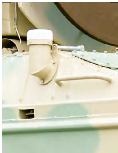
Размещение антенны угломерной двухантенной системы Placement of angular antenna of two antennas system

С целью повышения комфорта расчета как на стоянке, так и в движении, в состав боевой машины 9А33-1Б включена система кондиционирования и отопления.