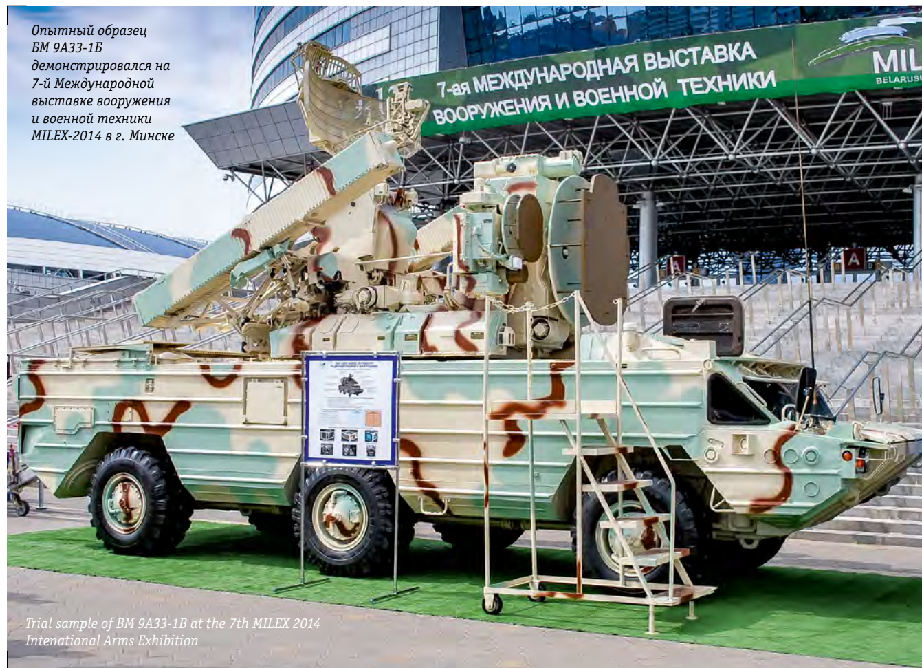
Опытный образец БМ 9А33-1Б демонстрировался на 7-й Международной выставке вооружения и военной техники MILEX-2014 в г. Минске

Модернизация штатных систем боевой машины и ввод принципиально нового оборудования по сравнению с прежними модификациями позволяет: