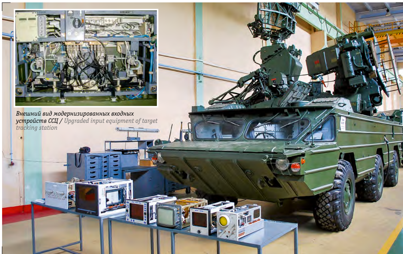
Отдельные модернизированные блоки БМ 9A33-1Б в ремонтном цехе / Upgraded units of BM 9A33-1B in the overhaul shop

Creative team of designers had the following tasks: