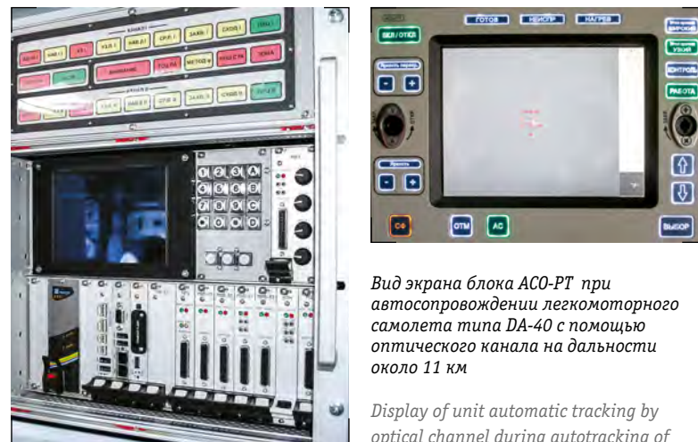
Внешний вид блока СВ-РТ SV-RT unit