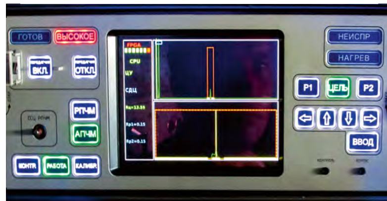
Вид индикатора дальности ССЦ / Range indicator of target tracking station