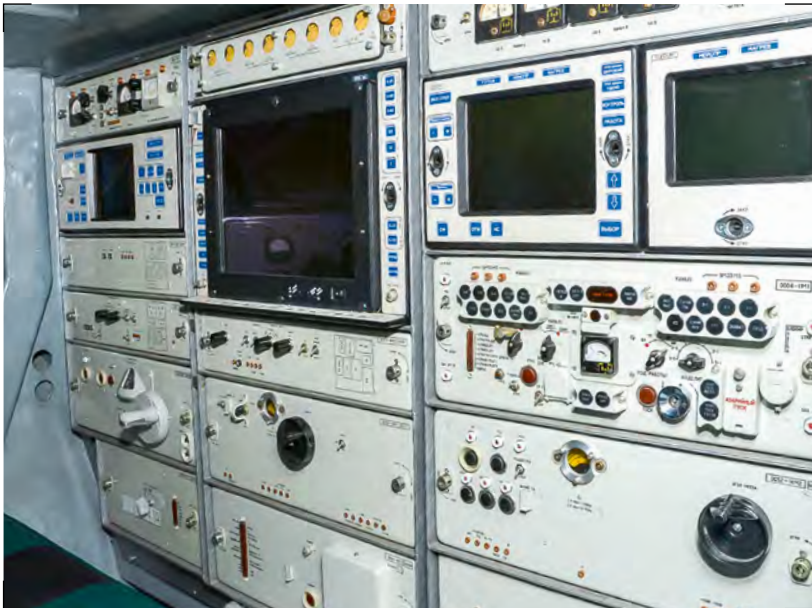
Внешний вид рабочих мест операторов БМ 9А33-1В Operators workstations of BM 9A33-1B

устаревших ламп бегущей волны УВ-67, УВ-75Г. Это позволило повысить чувствительность приемного устройства за счет снижения коэффициента шума, увеличить дальность обнаружения цели, повысить надежность, упростить и сократить процесс технического обслуживания.