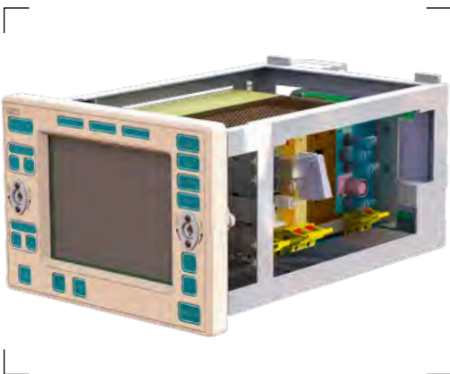
Внешний вид блока АСО-РТ Unit of automatic tracking by optical channel

In the 9A33-1B combat vehicle, the workstation for a commander is a completed separate workplace. This workplace permits to evaluate radar