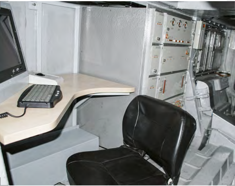
Внешний вид рабочего места командира боевой машины Workstation for a commander

Причиной этого служит наличие в его составе ряда специальных комплектов, давно снятых с производства. Именно поэтому вместо модернизации отдельных элементов штатного СРП специалисты заменили его на новый блок — спецвычислитель СВ-РТ.