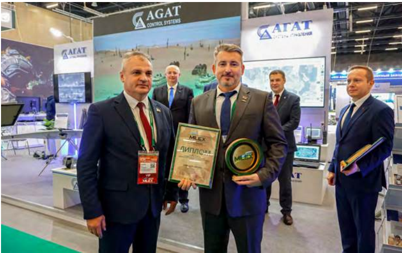
↑ На XII Международной выставке вооружения и военной техники MILEX-2025

Имея большой опыт в разработке такого рода аппаратуры и программных продуктов коллектив ОАО «АГАТ-СИСТЕМ» сумел не только сохранить лидерство в реализации подобных проектов, но и расширил прежнюю тематику и присутствие на рынке автоматизированных информационных систем (АИС). Качество выпускаемых изделий подтверждают многочисленные награды и повышенный интерес специалистов и потребителей. Как пример — диплом «За вклад в развитие современных систем вооружения», полученный по итогам XII Международной выставки вооружения и военной техники MILEX-2025.