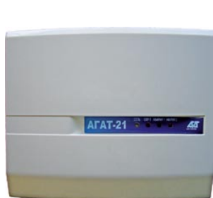
АГАТ-21, прибор приемно-контрольно-охранный