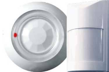
Оптико-электронные пассивные извещатели ИО-П и ИОН-О