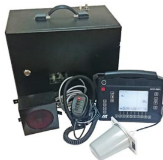
Терминал локомотива стандарта GSM-R «Агат-R801»