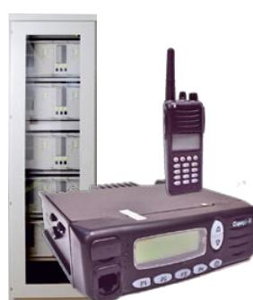
Комплекс средств связи «Сириус»