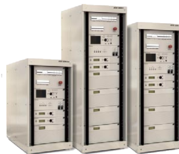
Линейка телевизионных передатчиков DVB-T/T2

ниями. Технические решения на предприятии разрабатываются исключительно на базе современных информационных технологий. При этом компания оказывает услуги по сопровождению своих автоматизированных систем специального назначения на всех стадиях – от написания технического задания, их разработки и установки до обслуживания и сопровождения готового программного обеспечения.