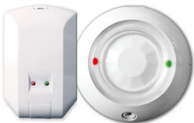
Поверхностный звуковой извещатель ЛИРА и извещатель совмещенный ФИЛИН-2

Сегодня ОАО «АГАТ-СИСТЕМ» демонстрирует неизменную стойкость к одному из ярчайших трендов эры сети интернет – сверхконкуренции на рынке информационных технологий. Несмотря на очевидное развитие этого процесса, предприятие неизменно занимает лидирующую позицию в своем сегменте.